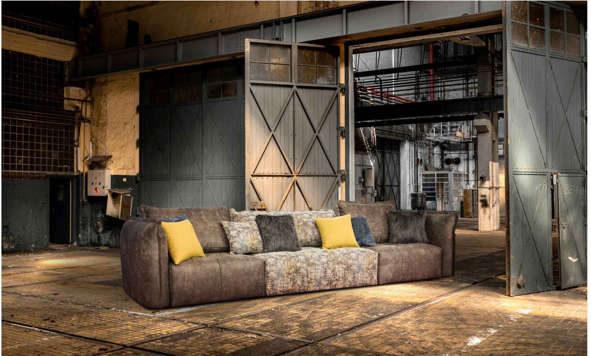
Elements (Fabrics): B100L (Caldora 10) + E150 (Manta 22) + B100R (Caldora 10)