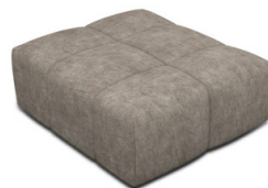
P000 (88 cm x 42 cm x 105 cm)