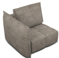
B100L (111 cm x 96 cm x 121 cm)