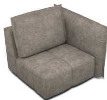
B100R (111 cm x 96 cm x 121 cm)