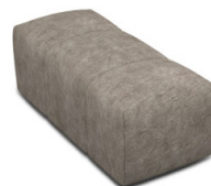
P010 (44 cm x 42 cm x 105 cm)