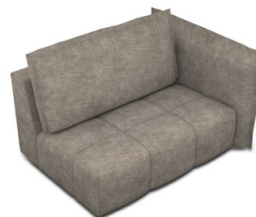
B150R (154 cm x 96 cm x 121 cm)