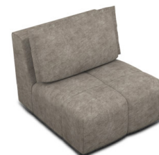
E100 (88 cm x 85 cm x 105 cm)