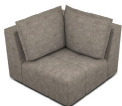
EK00 (105 cm x 90 cm x 105 cm)