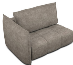
B150L (154 cm x 96 cm x 121 cm)